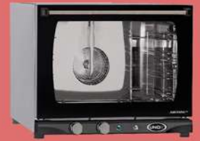
XFT 133 (Manual H-)

復古旋鈕 時間、溫度、手動加濕 時間控制旋鈕0~60分鐘， 可持續加熱。 溫度控制旋鈕30~260℃。 手動加濕按鍵。 電壓：220V-1N 3kW 尺寸：600x655x509mm 盤數：460x330mm 4層 盤距：75mm